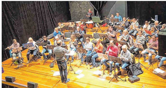
Die Geißlitztaler Musikanten suchen neue Mitspieler, die sich gern in den offenen Proben des Orchesters im Kulturschloss Großenhain dazugesellen können.

Die Amateurmusiker aus dem Raum Riesa, Großenhain, Meißen und Elsterwerda, wagen sich nicht nur an traditionelle Blasmusik heran, sondern studieren auch anspruchsvolle Konzertmusik bis hin zur Unterhaltungsmusik ein. Was ihnen allen gemeinsam ist: Sie spielen als Kind schon ein Blasinstrument in einem Orchester. Manche hatten die Instrumente wie Trompete, Flügel-, Wald- und Tenorhorn oder Tuba über Jahre und Jahrzehnte schon einmal auf dem Dachboden verstaubt und ihre Flöte, Klarinette oder Oboe in den Schrank geräumt. Kaum einer konnte sich vorstellen, dass diese alten Instrumente eines Tages doch wieder das Tageslicht erblicken könnten. Ausbildung, Beruf, Familie, Kinder, das war damals wichtiger für viele. Da war kaum Spielraum für Gedanken an Musik. Aber als die Kinder erwachsen wurden, taten sich bestimmte Freiräume wieder auf. Es kam die Zeit, sich zurückzubesinnen an die